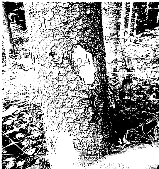
Дерево № 24