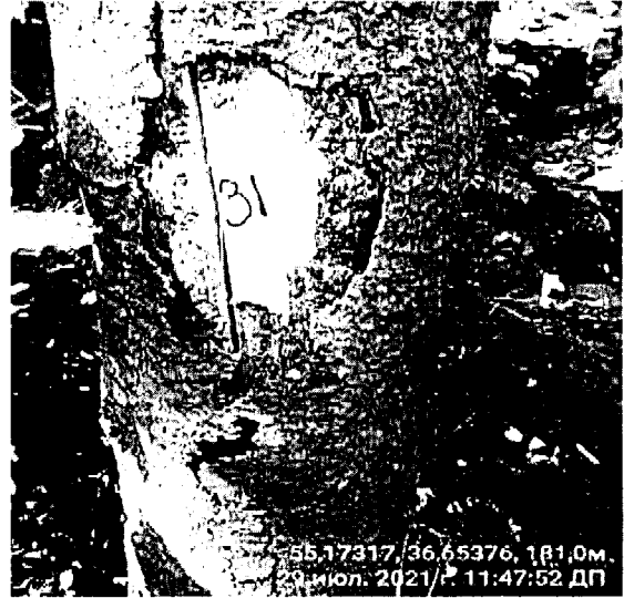
Дерево № 31