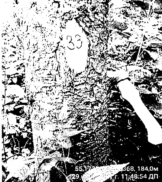
Дерево № 33