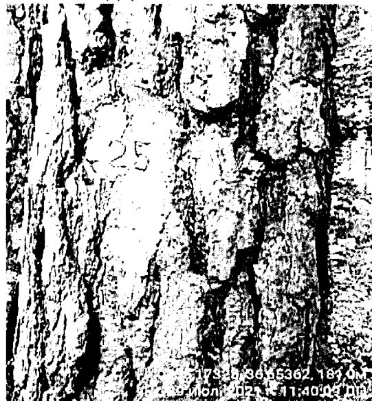
Дерево № 25