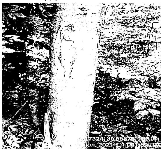
Дерево № 27