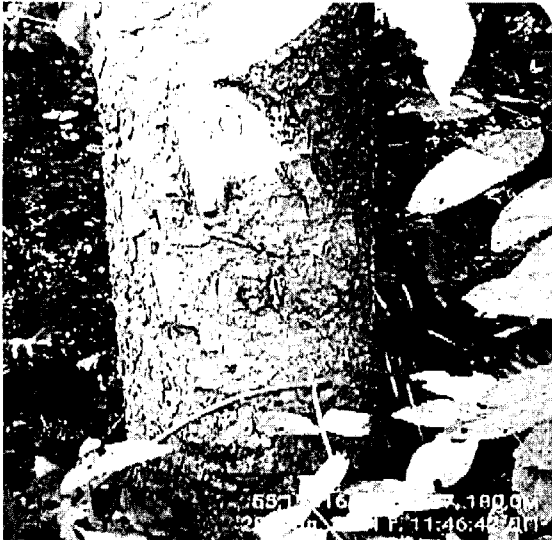
Дерево № 30