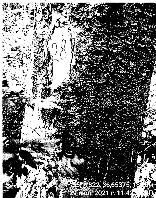
Дерево № 28