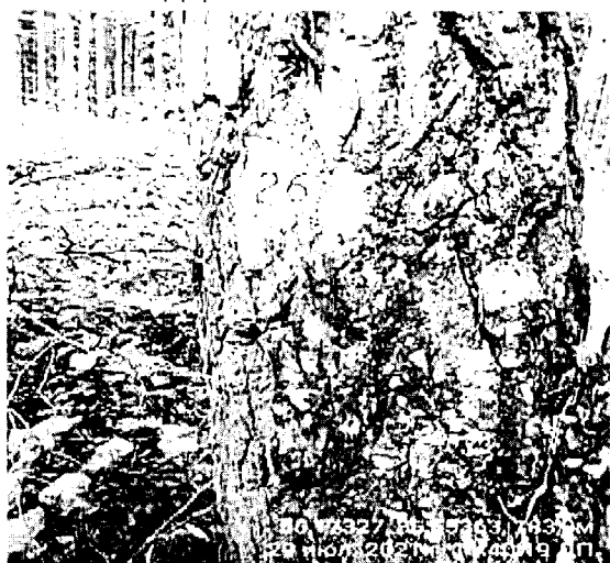
Дерево № 26